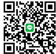
QR Code (Group Line)

ช่องทางติดต่อสอบถามสำหรับผู้สมัครสอบเท่านั้น