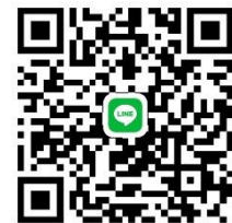
QR Code (Group Line)

ช่องทางติดต่อสอบถามสำหรับผู้สมัครสอบเท่านั้น